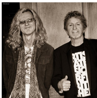
Roine Stolt with Jon Anderson